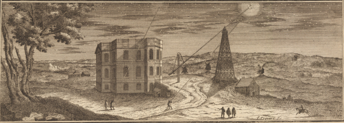
Tableau de la Vue de l'Observatoire sur le Mont de la Ville de Paris, lequel est un point de vue sur le Mont de la Ville.