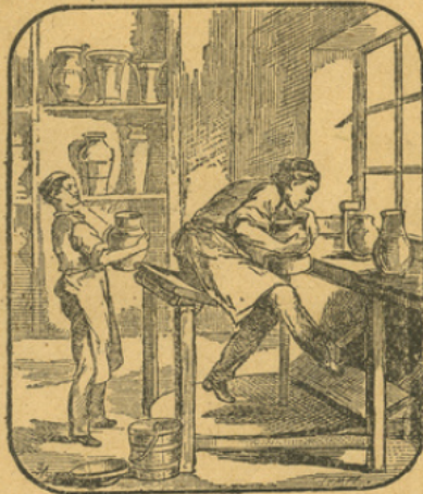
L'ARGILE A POTIER