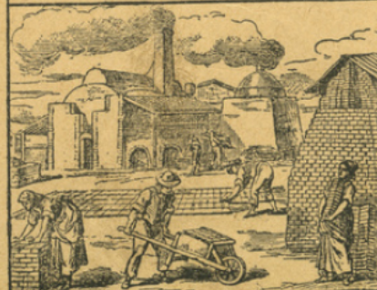
LA TERRE GLAISE