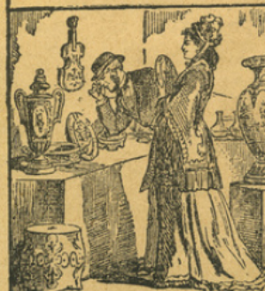
LA TERRE DE PIPE