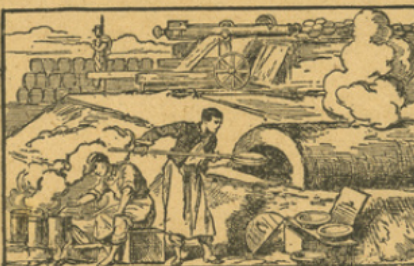
LES FOURS DE CAMPAGNE