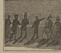
23 Los sobrinos sin parar van en busca del «Escocia» para poderse embarcar.