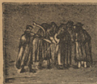
1 Por la murga empezamos los fabulosos viajes que á rasgos describiremos.