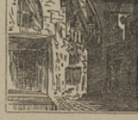
21 Solos y á puerta cerrada los bandidos en consejo están dentro la posada.