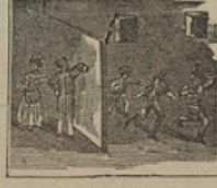
22 De frente son atacados los bandidos, con denuesto, siendo al punto dispersados.