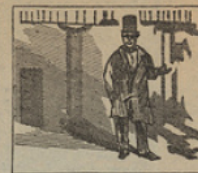
5 Con aires de tejedor observas el bel retrato del muy famoso Doctor.