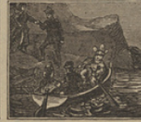
38 Atanados todos van no hallándole en su cabaña, se busca del Capitan.