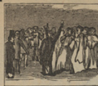
4 Los vecinos convocados examinan el Canuto contentos y entusiasmados.