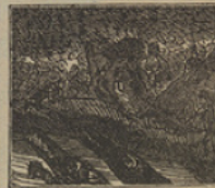
18 En alto buscan ansios, para salvar su pellejo de los fieros cocodrilos.