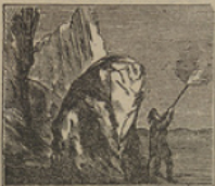
14 Diligente, y con ardor, rescata el guía al médico dando la muerte al Condor.