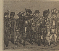
42 Se le presentan mohinos, y el Capitan asombrado, dice no tener sobrinos.