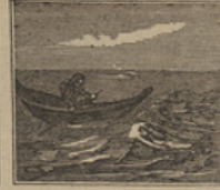
26 Con pena, el lugar se halló, donde hacia poco tiempo que el «Escocia» naufragó.