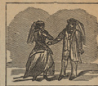
6 Lector, tu mirada fija en estos dos personajes, Lord Glenarvan y su hija.