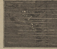
27 El buque se sumergió dentro del mar, y un respetable tesoro al fondo del mar quedó.