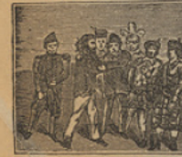
43 Le ruegan tan adigidos y apurados, que á la postre se sienta por sobrinos.