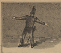
2 Contemplad bien la postura del subteniente Mochila, y su chocante figura.