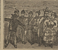
44 Grant les ha manifestado que el codiciado tesoro se halla á la vista.