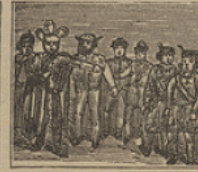
46 Con acertada propuesta propone el Doctor hallarlo, y en efecto, poco cuesta.