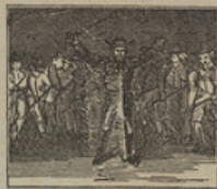
16 En un solitario llano, está arrojado á sus tropas, un general mejicano.