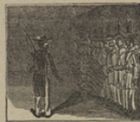
15 Los agguerridos soldados del comandante Fragrante, le están muy subyugados.