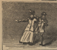
3 Tronados del todo están los pretendidos sobrinos del bravo Capitan Grant.