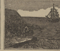
40 La gente examina lista, la soberbia arboladura de un buque que está á la vista.