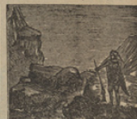
12 Con indecible alegría, al conocer el terreno, se les proporciona un guía.