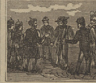
41 Llegó al término su afán, y al cabo de mucho tiempo encuentran al capitán.