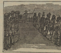
17 Su rabia feroz se exhala huyendo á los viajeros con la pólvora á la baía.