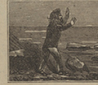
39 ¿Quién dijera al Capitan que es por falsas sobrinas suceso con tanto alar?