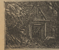
37 Muy satisfechos están, porque hallaron la cabaña del bravo Capitan Grant.