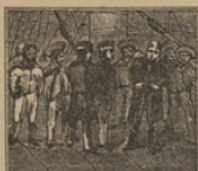
8 El Doctor se ha equivocado, y en vez del «Escocia» ha embarcado.