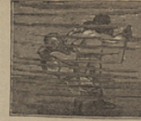
29 Mochila libra un combate con el bandido, logrando de aquel tesoro el rescate.