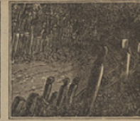
30 La suerte los trajo aquí, adigidos prisioneros en una cueva maorí.