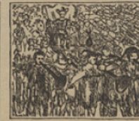
47 El Doctor le encuentra aquí con honras entusiasmado como jefe maorí.