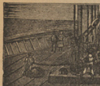
7 Los sobrinos, con aún se embarcan en el «Escocia» en busca del capitán.