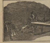
19 Acercando á los viajeros, está aquí este personaje capitán de bandoleros.