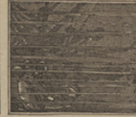
28 Los diamantes sumergidos dentro del mar, son robados por el jefe de bandidos.