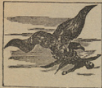
13 A pesar de su valor, el doctor fue arrebatado por un enorme Condor.