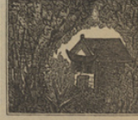
24 Con asombro general, encuentran una cabaña de un pescador de coral.