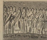
9 Aunque elegantes y hermosas, son, con todo, estas mujeres, en extremo misteriosas.