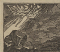
32 Mirad la llama elevada que vomitaba el volcan, en la montaña sagrada.