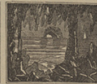
34 Por fin vienen á parar á una grandiosa gruta en las orillas del mar.