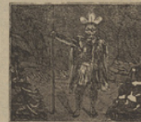
35 Cosa rara pasó allí el Doctor fué proclamado primer jefe maorí.