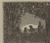
11 Con asombro contemplaron las llanuras argentinas, en donde han desembarcado.