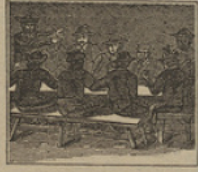
20 Atentos y prevenidos se hallan de él no distantes su cuadrilla de bandidos.