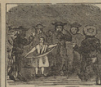
10 De mujeres y hombres llena, está una gran plaza, en una plaza chilena.