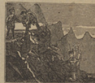
36 Por el suceso animados, temerosos á los viajeros convertidos en soldados.