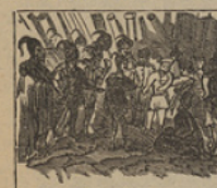
31 Los zelandeses salvajes, pretenden devorarnos para acabar sus viajes.