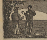
25 Le piden al pescador una escudra, y le ofrecen un regalo de valor.