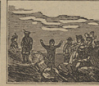
45 Como tal nueva no espera, sabedor de tal desgracia Mochila se desespera.