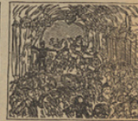
48 Valen un Potosí los diamantes encontrados en el Templo maorí.

Se halla de venta en la papelería y efectos de escritorio del Sucesor de Antonio Bosch, calle del Bou de la Plaza Nueva, 15.—Barcelona.