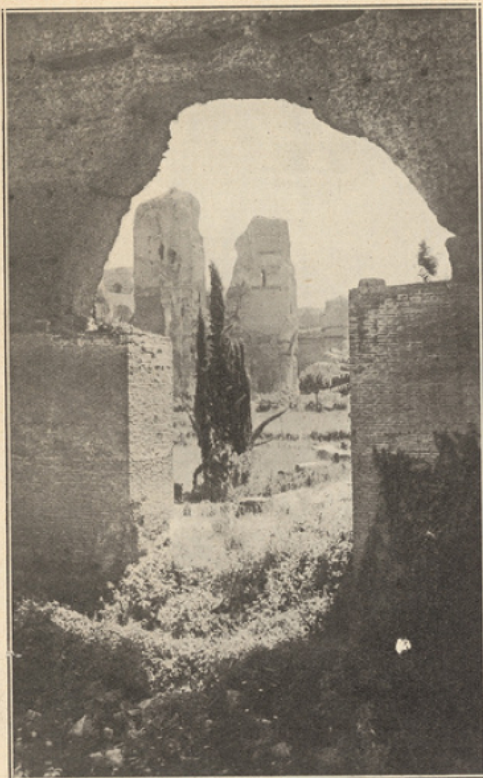
Les Thermes de Caracalla.