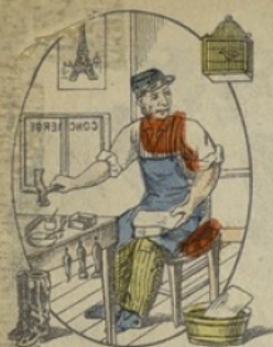
PLANCHE N° 360

C'est pourtant un bien brave homme que le père Grattemolle, concierge de père en fils et cordonnier naturellement.