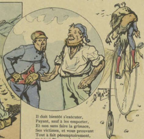
Il doit bientôt s'exécuter, Payant, sauf à les emporter, Et non sans faire la grimace, Ses victimes, et vous prouvant Tout à fait péremptoirement, Qu'ainsi Pierre qui roule amasse, Simon de la mousse, parfois Des poules, des canards, des oi's.