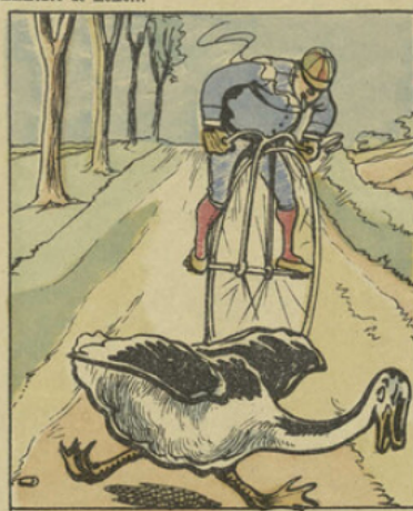
Du coup sur la gauche il appuie; Mais, dans son imbecillité, Voilà la volaille ahurie Qui s'enfuit du même côté.