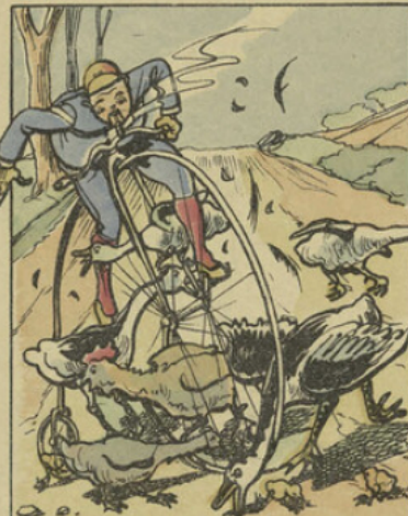
Affolés, fuyant au hasard, Voici que l'oie et le canard Revenant, la bande complète A travers les rayons se jette.