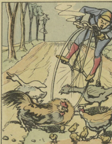
Virant alors très brusquement, Il tombe malheureusement De poulets dans une famille, Qui sous son bicycle fourmille.