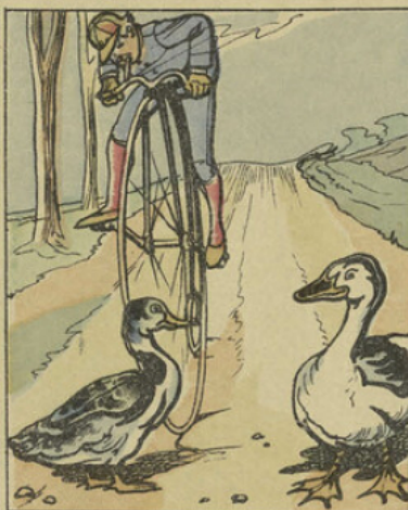
Se détournant avec adresse, Il rentre au milieu du chemin, Quand, venant Dieu sait d'où, soudain Un canard devant lui se dresse.