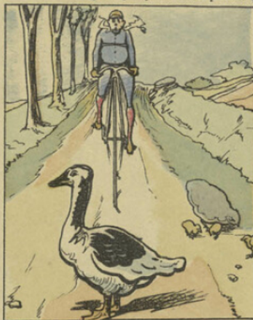
Roulant sur une large voie, Au beau milieu surgit une oie, Qui semble, ignorant le danger, Ne pas vouloir se déranger.