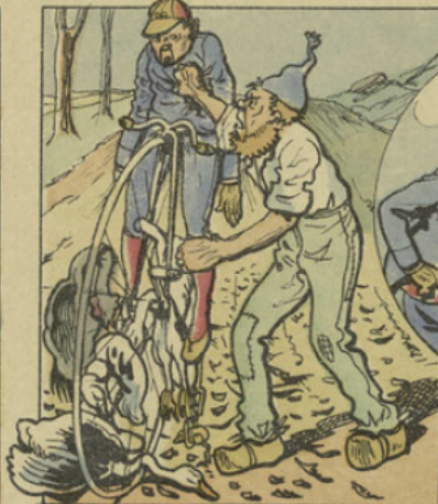
Pauvre Quiroul, pas méche hélas! De sortir de ce mauvais pas, Et, malgré ses efforts, bien vite Il est arrêté dans sa fuite.