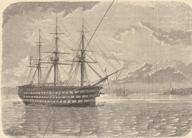
ÉCOLE NAVALE DE BREST. — LE BORDA, navire-école à trois ponts. (Voir page 419.) — Dessin de M. de Drée.

l'École. Un capitaine de frégate commandant en second, un agent comptable économe, un officier d'administration et deux médecins complètent l'état-major du vaisseau. Enfin, un capitaine d'armes, des adjudants et des officiers marins sont préposés à la surveillance et à l'instruction des élèves.