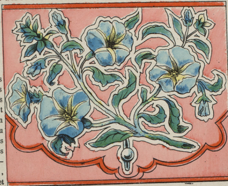
Motif de broderie pour trousse

Ce genre est spécial pour fleurs, feuilles, chiffres et monogrammes.