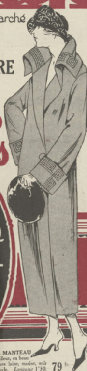
156-1002. MANTEAU fait par tailleur, en beau velours pure laine, marine, noir ou tous mode. Longueur 1730. 79 fr.