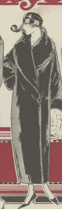
88-070. MANTEAU fourrure, en colombia électrique, belle qualité, doubleur satin fastidie. Longueur 1725 . . . . . 595 fr.