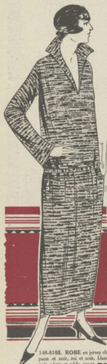
148-8188. ROBE en jersey chiné, pau et noir, roi et noir, blanc et noir, noir et blanc, rouge et blanc. Le robe . . . 79 fr.