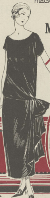
64-7412. ROBE en crêpe marocain marin ou noir. . . . . 125 fr.