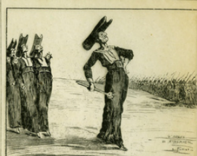
Fig. 9. — L'invasion cédricole succédant à l'invasion prussienne, d'après une lithographie de Daumier parue dans le Charivari.