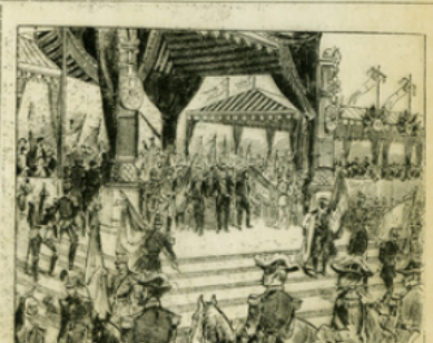
Fig. 12. — La première fête du 14 juillet. Distribution des nouveaux drapeaux à Longchamp (1887) par Jules Grevy, Léon Say et Gambetta.