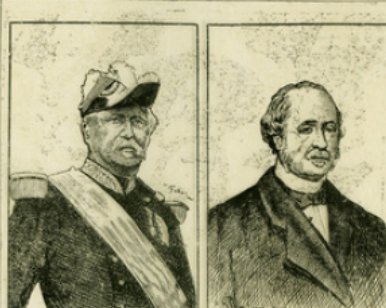
Fig. 11. — Le maréchal de Mac Mahon. — Le duc de Broglie.