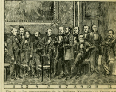
Fig. 6. — Le gouvernement de la Défense Nationale : 1) Emile et Arago ; 2) Rochefort ; 3) Ad. Crémieux ; 4) Glais-Bizoin ; 5) Ernest Picard ; 6) Le général Trochu, président ; 7) Léon Gambetta ; 8) Gaston-Pagès ; 9) Jules Favre ; 10) Jules Simon ; 11) Jules Ferry ; 12) Eugène Pelletan.