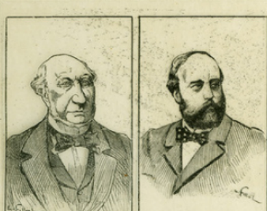
Fig. 10. — Wallon. — Le comte de Chambord.