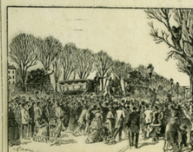
Fig. 4. — Aux obèques de Victor Noir, tué par Pierre Bonaparte, la foule manifeste contre le gouvernement impérial.