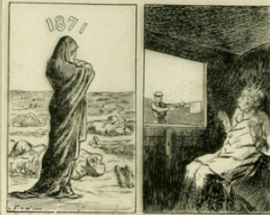
Fig. 8. — Deux dessins de Daumier. L'un représente la France en deuil devant la quantité de morts de l'année 1871 ; l'autre le trois-porte-drapeau : un drapeau se rendant à Versailles recueilli d'effroi à la vue du drapeau rouge d'un garde-barrière.