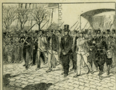
Fig. 1. — Les républicains condamnés par les commissions mixtes (1859) sont déportés à Lambessa et à Cayenne.