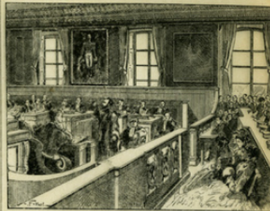
Fig. 3. — Le procès Daudin. Léon Gambetta, alors jeune avocat, prononce en faveur de Delucet une plaidoirie qui est un véritable acte d'accusation contre l'Empire (1868).