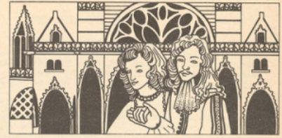
En 1660, Molière crée le personnage de Sganarelle et devient « le premier farceur de France », au dire d'un contemporain.