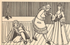
Pensionné par le roi, Molière est calomnié par les comédiens de l'Hôtel de Bourgogne. A cause de Tartuffe , il est accusé d'impiété. Mais, en août 1665, sa compagnie devient Troupe du roi.