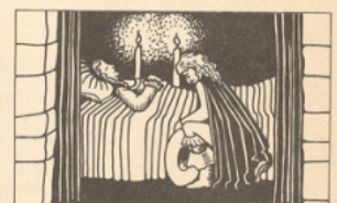
Les épreuves se succèdent. Molière, malade en 1665, perd son père en 1669. Trois ans plus tard, il pleure Madeleine Béjart, morte à l'âge de cinquante-cinq ans après une longue maladie.