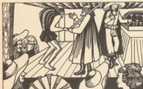
Élève des Jésuites au collège de Clermont, Jean-Baptiste traverse souvent le Pont-Neuf où les bateleurs et les farceurs enfarinés le séduisent. Sans doute est-ce le début d'une vocation.