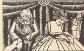
Licencié en droit (1642), il s'associe avec Madeleine Béjart (janvier 1643) pour constituer une troupe de comédiens, l'illustre Théâtre. L'année suivante, il prendra sur la scène le pseudonyme de Molière.