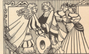
Sans pouvoir rivaliser avec les théâtres de l'Hôtel de Bourgogne et du Marais dans le tragique, la troupe de Molière se taille un succès dans le comique avec les Précieuses ridicules (1659).