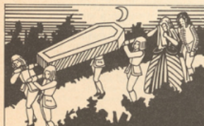
17 février 1673 : Molière tombe malade durant la quatrième représentation du Malade imaginaire et meurt quelques heures plus tard. Les comédiens étant excommuniés, il est enterré de nuit, le 21.