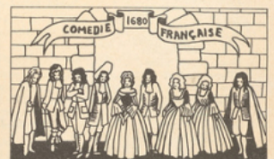
Le 16 août 1680, la troupe de Molière qui avait déjà fusionné avec la troupe du Marais en juin 1673, s'unit avec les Grands Comédiens de l'Hôtel de Bourgogne pour fonder la Comédie-Française.