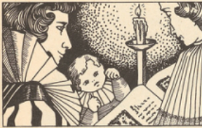
15 janvier 1622 : Baptême de Jean Poquelin, à l'église Saint-Eustache. En famille, on l'appellera Jean-Baptiste deux ans plus tard, après la naissance d'un autre garçon baptisé Jean lui aussi.