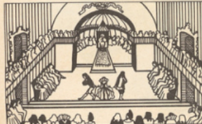
Après avoir joué en province, surtout dans le sud de la France, durant treize ans, la troupe (dix acteurs et actrices) s'installe en 1658 à Paris, dans la salle du Petit-Bourbon prêtée par le roi.