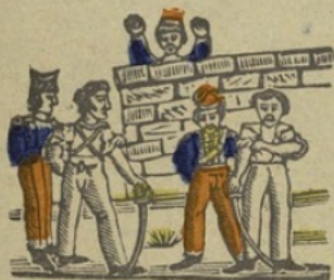
Duel D Duel. Da de di do du.