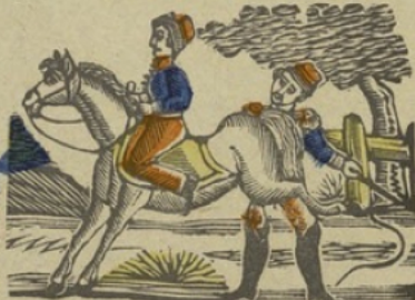
Lecon d'équitation L Les in rijden. La le li lo lu.