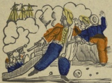
Algeriaen A Algerien. a e i o u ij (Voyelles.)