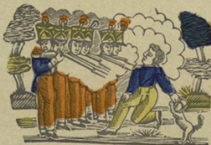
Execution militaire E Executio (militaire.) la voyelle E.