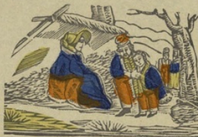
Bivak B Bivouse. Ba be bi bo bu.