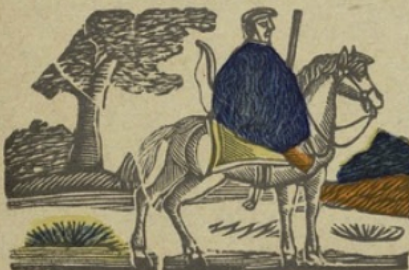
Kalmouc K Kalmoue. Ka ke ki ko ku.