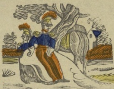
Halte H Halte. Ha be bi ho hu.