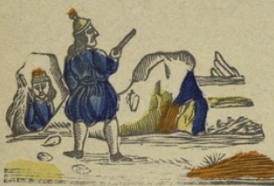
Grecs G Grieken. Ga ge gi go gu.