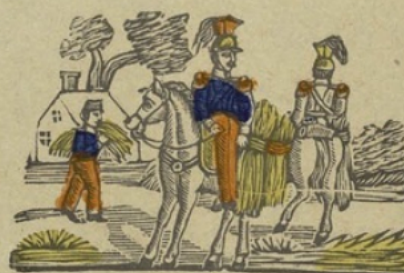
Fourageurs F Fourageurs. Fa fe fi fo fu.