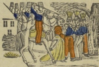
Cosacken C Cosaques. Ca ce ci co cu.