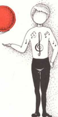
une note de musique