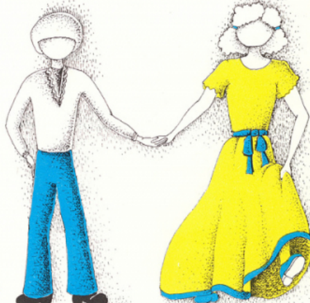
un couple de danseurs