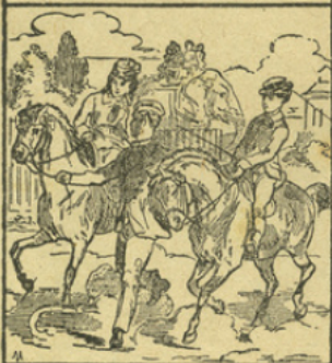
LE CHEVAL NAIN