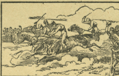
LE CHEVAL DE CORSE