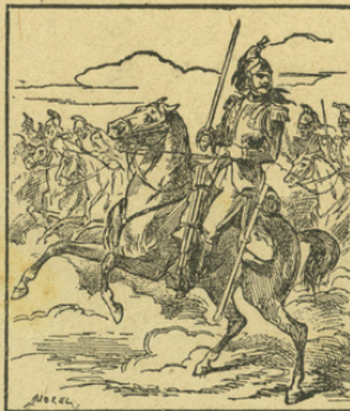
LE CHEVAL DE GUERRE