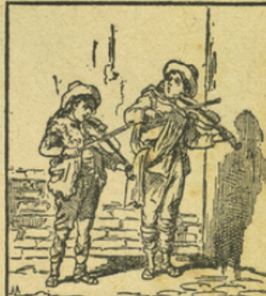
LE CRIN DE CHEVAL