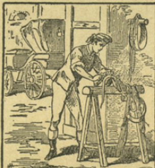
LE CUIR DE CHEVAL

Extrait de l'Imagerie des connaissances utiles par Ad. LINDEN