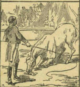
LE CHEVAL SAVANT