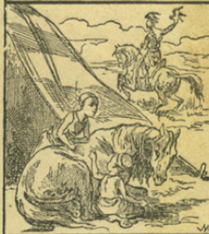
LE CHEVAL ARABE