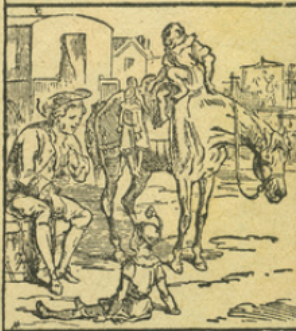
LE CHEVAL DE SALTIMBANQUE