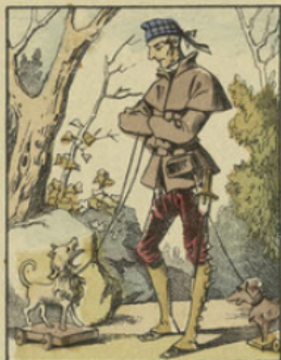
Voilà que Milady Crakford vient à mourir subitement. Milord en conçoit un tel chagrin qu'il ne peut plus ni boire ni manger. Il a pris la chasse en horreur; il voit tout en noir.