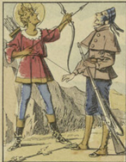
Crakford est émerveillé, à chaque coup d'arbalète; son hôte abat, soit un perdreau ou des caillies, ou des allouettes toutes rôties.