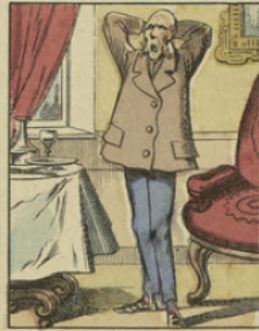
Cependant, grâce au climat humide de l'Angleterre, la figure de Milord reprit sa couleur naturelle, seulement ses favoris ont conservé une forte couleur carotte.

OFFERT PAR THE SPORT BOULEVARD MONTMARTRE PARIS