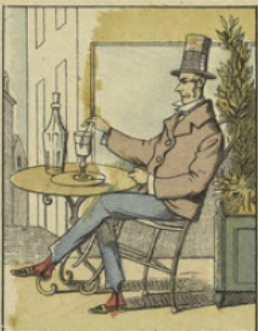
Milord Crakford est un des plus enragés chasseurs de toute l'Angleterre; en savourant un grog au rhum, Milord combine une fameuse partie de chasse.