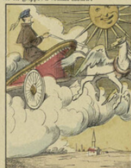
Voilà Milord parti dans le char du soleil; il passe rapidement sur l'Europe, l'Afrique, et sur une foule de localités qu'il ne connaissait que de nom. Il fait un voyage plein d'agrément, et il arrive enfin dans les Etats du soleil.