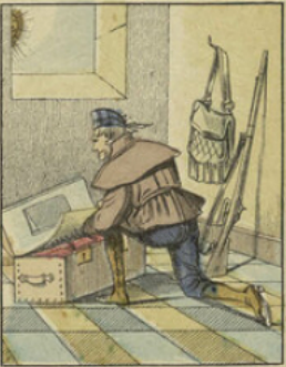
Craignant de se trouver bientôt tout à fait cuit, Crakford se hâte de faire sa malle pour s'en aller.