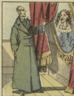
Milord passe des journées entières devant le portrait de Milady, à gémir et pousser des soupirs. Cependant Milord constate que son épouse chérie louchait horriblement, qu'elle avait un drôle de nez, et aussi l'air d'une cuisinière.