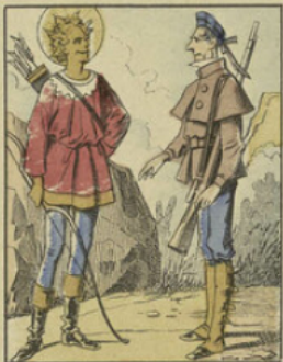
Partis pour la chasse, Milord est bientôt surfoqué par la chaleur. Ouf! s'écrie Milord, je suis trempé comme une soupe, je me comme une fontaine; vous n'auriez pas une chemise et un gilet de flanelle à me prêter?