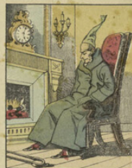
Toujours assis au coin de sa cheminée, Milord continue à broyer des idées noires. D'ailleurs, les brouillards de l'Angleterre étaient loin de lui donner des idées bien gaies; aussi il avait pris la vie en grippe: il voulait mourir.