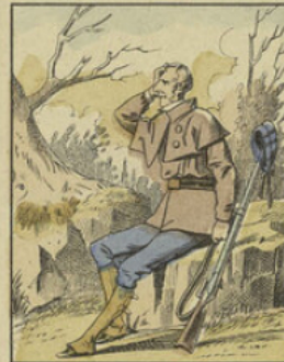
Quant à Milord, il attrape un fameux coup de soleil sur la figure, il vient rouge comme une écrevisse. Fichtre, il fut décidément trop chaud ici, je voudrais bien m'en aller, pensa Crakford.