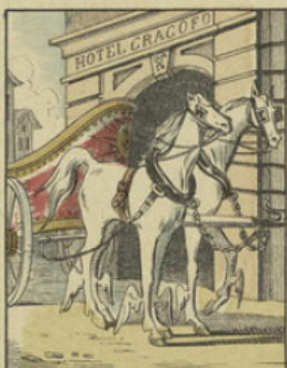
Le soleil entend sa prière, il invite Milord à une partie de chasse pour le réchauffer: il lui envoie galamment son cabriolet pour l'amener dans ses Etats.