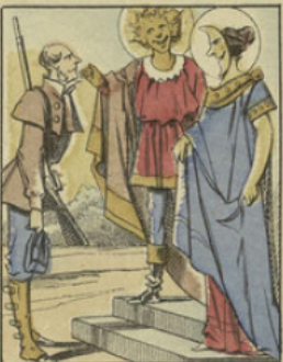
Il est reçu à bras ouvert par le soleil; qui le présente à M me la lune: «Tiens, tiens, dit-elle, la drôle de binette, où avez-vous pêché cet oiseau-là.»