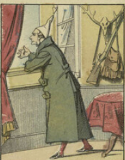
Depuis plus de six mois, le soleil tournait le dos à l'Angleterre; Milord le prie, le supplie de se montrer ou de lui envoyer seulement quelques petits rayons pour le réchauffer.