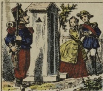
PLANCHE N° 638.

Madame la Gouvernante! Nom d'un nom! quel beau brin de femme!