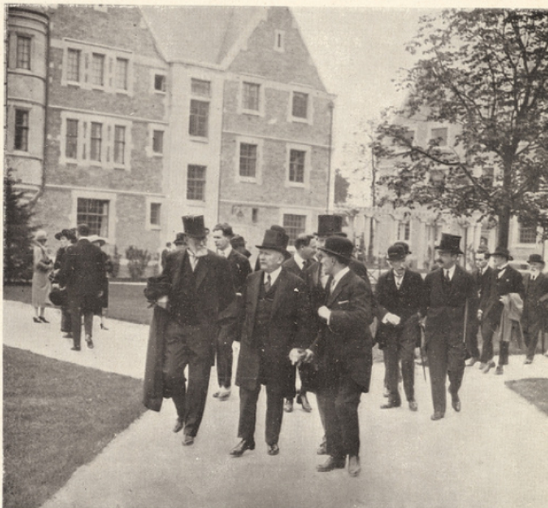
Le Président de la République visite, avec intérêt, les pavillons de la fondation Deutsch de la Meurthe.

La Fondation Deutsch de la Meurthe ne sera pas la seule agglomération de la Cité Universitaire: de nombreuses nations étrangères auront leurs pavillons. Plusieurs sont dès maintenant commencés. Enfin, un grand parc a été prévu; de vastes terrains lui sont réservés, il sera sous peu aménagé. Ainsi le prestige de la France n'aura pas à souffrir d'une redoutable concurrence. Les étudiants français et étrangers seront assurés de trouver à la Cité Universitaire de Paris, le bien-être matériel et le calme nécessaires dans l'accomplissement de leurs études.