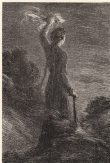
Le signe de la nuit, (2 e acte de Tristan et Yseult ), (d'après Fantin-Latour).

Il faut lire dans La Vie amoureuse de Richard Wagner , de M. Louis Barthou, le drame de cette séparation. Auprès d'Hélène, Minna et Cosima paraissent fades. Oui, même Cosima. Qu'importe dès lors que l'amour de Richard Wagner et d'Hélène Wesendonck ait été ou non réalisé ? Tristan est sorti de là. Tristan , la plus tragique musique de l'amour. M. Barthou qui avait étudié avec tant de ferveur et d'érudition les grands romantiques, Victor