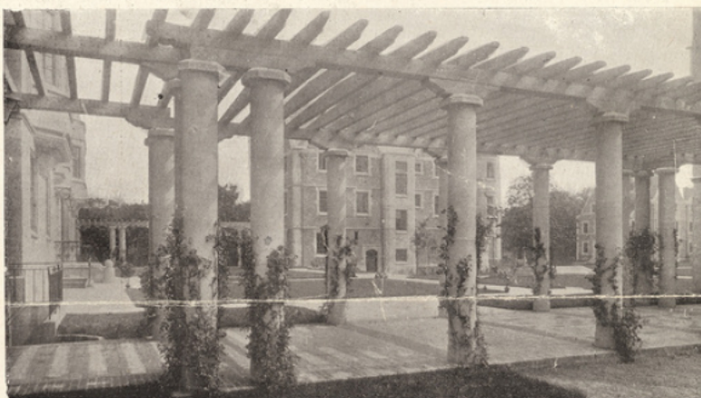
Une des pergolas qui relient les différents bâtiments.

les vastes terrains concédés par le Gouvernement et la Ville de Paris, et avec les deux millions généreusement offerts par M. Emile Deutsch de la Meurthe, plusieurs corps de bâtiments ont été élevés, reliés les uns aux autres par de délicieuses pergolas et encadrant une grande cour tapissée de vertes pelouses et plantée d'arbres. A l'image des Universités anglaises, et d'Oxford en particulier, les pavillons sont bas et de dimensions moyennes, donnant l'illusion d'une véritable ville avec ses maisons complètement distinctes. Un gracieux clocher domine le tout, accolé au bâtiment central, réservé aux salles de réunions. Les chambres sont claires, et aérées, quoique fort simples,