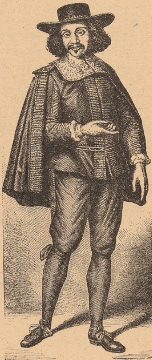
MOLIÈRE d'après un tableau du foyer des artistes de la Comédie française .