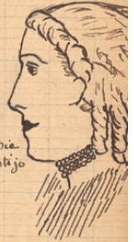
Eugénie de Montijo