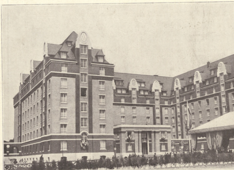
La Maison des provinces de France à la Cité universitaire de Paris. Guirrit, architecte.