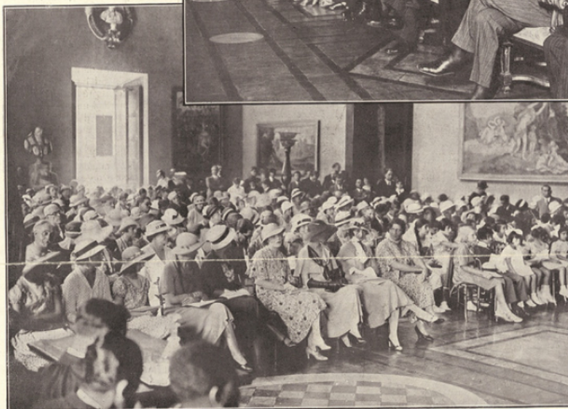
DANS LA SALLE D'HERCULE DU PALAIS FARNÈSE. — La distribution des prix du lycée Chateaubriand.

cessé de s'intéresser. Lorsque survint la mort de M re Dumaz, en 1929, la direction du nouveau lycée Chateaubriand fut confiée à M. Chaix-Ruy, agrégé de l'université, qui se voua avec une infatigable et intelligente ardeur à sa tâche. Il ne tarda pas à s'apercevoir d'une regrettable lacune, qu'il entreprit de combler : le lycée, bien que disposant dans l'un des quartiers les plus sains de Rome d'une vaste villa, propriété de l'Etat français, ne pouvait recevoir d'internes. Son effectif, d'autre part, était passé, entre 1929 et 1932, de soixante-dix à cent quarante-deux élèves, appartenant à une trentaine de nationalités différentes. Un projet de développement fut élaboré et, grâce à l'action déployée par le regretté ambassadeur M. de Beaumarchais, par M. Henry de Jovenel et par nos ambassadeurs auprès du Vatican, M. de Fontenay, puis M. Charles Roux, il est devenu une réalité. A partir de la rentrée prochaine, le lycée aura son internat, situé presque en face de l'externat, près de la célèbre porta Pia.