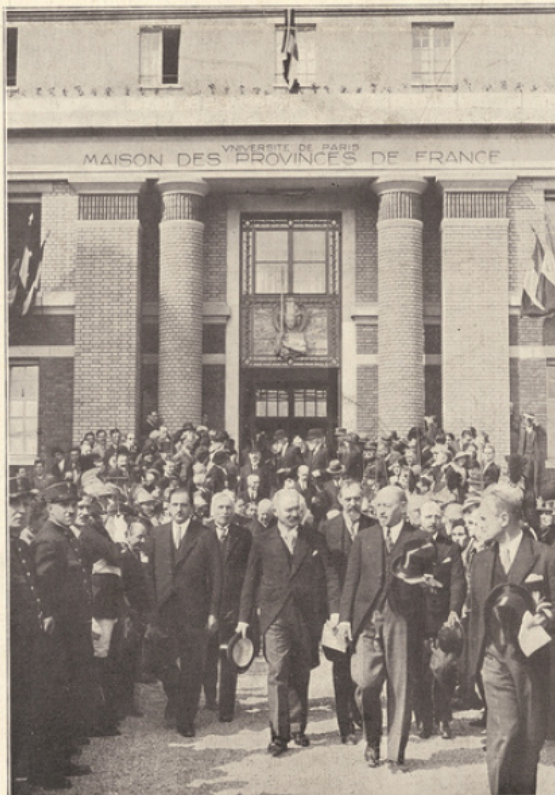
Le cortège présidentiel sortant de la Maison des provinces de France.

Au total, une belle et harmonieuse demeure dont l'auteur, M. Guirrit, peut être fier à juste titre. Une construction vraiment française, moderne, sans agressivité, où les 328 étudiants, pour qui elle fut conçue, retrouveront un peu l'âme et l'esprit de leur province.