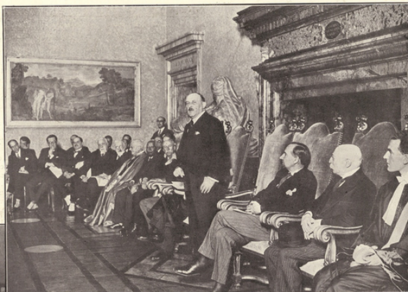
L'allocation de M. H. de Jovenel, ambassadeur de France à Rome.