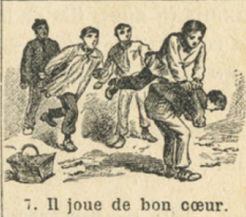
7. Il joue de bon cœur.

RENSEIGNEMENTS. — Comparez ce que fait Jules avec ce que font les enfants qui n'ont pas ses qualités. — L'élève ne dépose que de petites sommes à la caisse d'épargne scolaire; mais cela suffit pour qu'il apprenne l'économie.