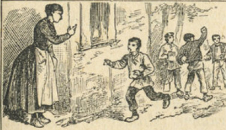
3. Il est obéissant.