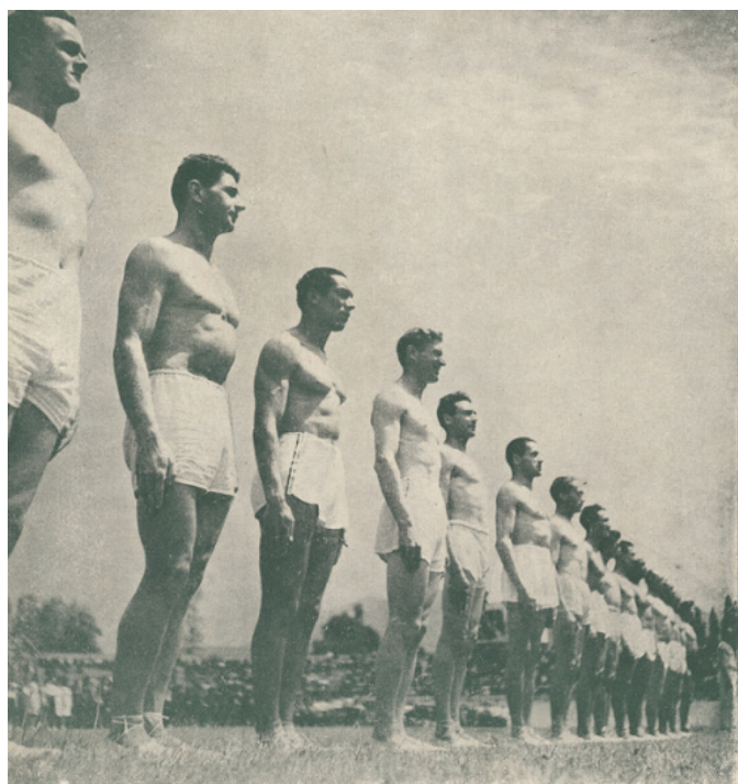
Les moniteurs du cadre du Collège national de Moniteurs et d'athlètes d'Antilles.