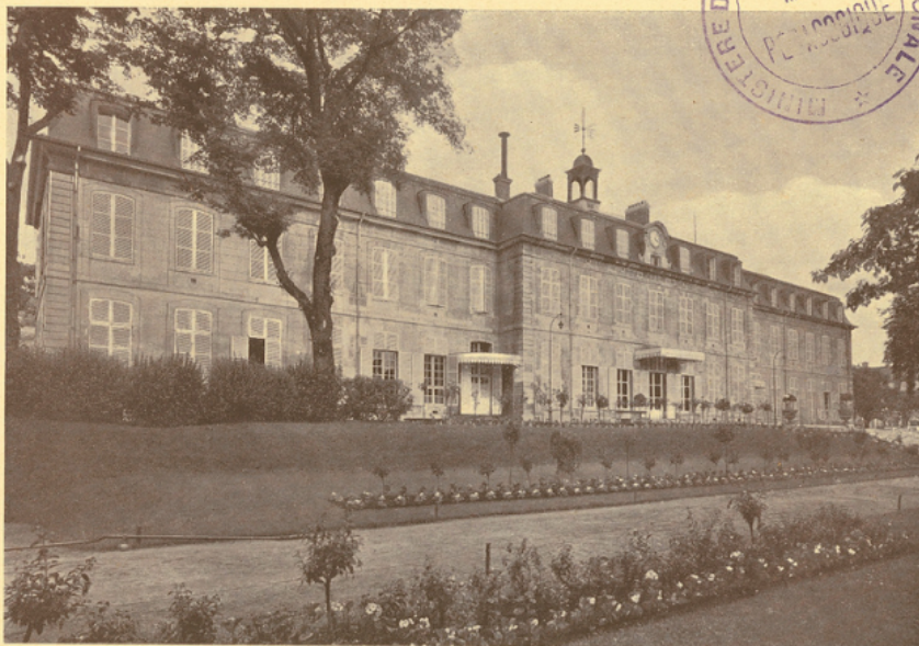
Le Pavillon Mansard.

Le lycée fut fermé en 1871 pendant le siège de Paris et la Commune et rouvert au mois d'octobre, sous le nom de lycée de Vanves. Il a pris seulement en 1888 celui de lycée Michelet. Pendant la guerre de 1914-1918, il a été transformé en hôpital, mais des locaux ayant été réservés pour les classes, l'enseignement, quoique réduit, n'a pas cessé d'y être assuré.