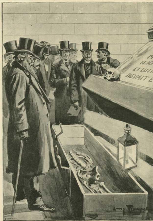
TOMBEAU DE VOLTAIRE.