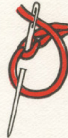
Point de chaînette