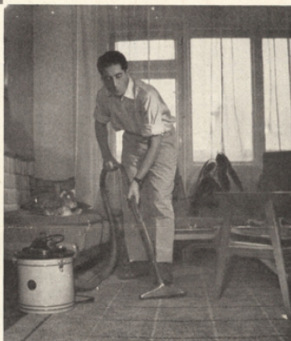
Résultat d'une bonne éducation, ou « comment l'esprit vient aux maris ».

DANS NOTRE pays, l'enseignement part de cette idée claire que l'enfant est un être dont il faut connaître la nature profonde et le milieu familial. Pour le suivre et en obtenir le maximum, il faut tenir compte de ces éléments. C'est pourquoi un instituteur prend un groupe donné, lors de la première rentrée scolaire, et monte avec lui pendant cinq ans. Avantage de la méthode ? — Vous connaissez à fond le caractère de chaque élève, ses points faibles, ses maladies, ses parents. Certes, si le pédagogue est médiocre, direz-vous, l'enfant ne sera-t-il pas sérieusement handicapé pour l'avenir ? Par bonheur, la direction de l'établissement et l'association des parents d'élèves surveillent les choses de près.