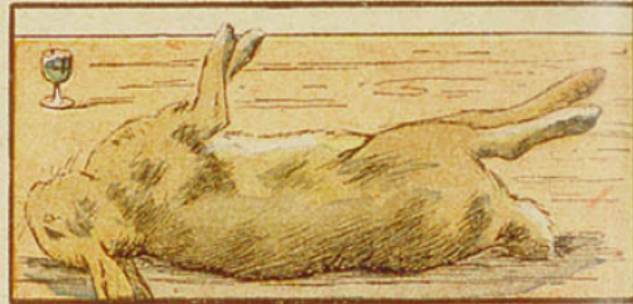
6. La moitié d'un petit verre d'absinthe produit l'épilepsie et la mort chez le lapin.