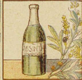
4. L'absinthe est doublement nuisible, par l'alcool et par l'essence qu'elle renferme.