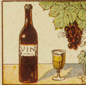
3. Un litre de vin équivaut à ce plein verre d'eau-de-vie, qui a le cinquième de sa capacité.