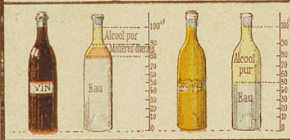
1. Le vin contient en moyenne 10 0/0 d'alcool; certains vins sont plus forts.