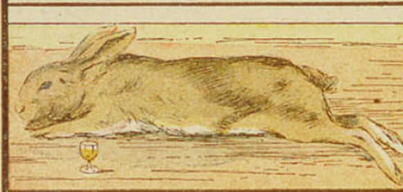
5. Un petit verre de cognac tue un lapin après tous les caractères de l'ivresse.