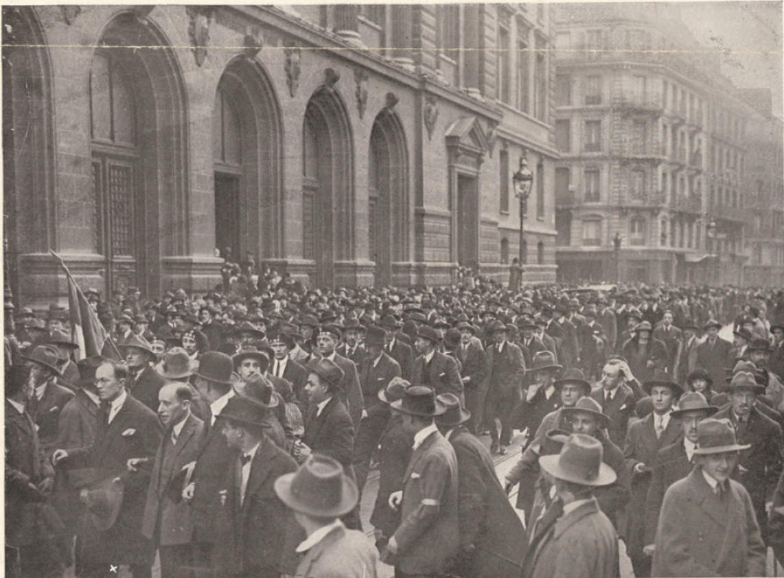
Le grand monôme de protestation des Etudiants de Paris, conduit par M. Gattino (x), président de l'A, défile dans le plus grand calme devant la Sorbonne.