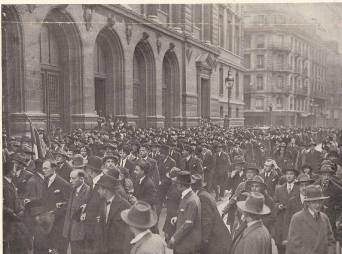
Le grand monôme de protestation des Etudiants de Paris, conduit par M. Gattino (x), président de l'A, défile dans le plus grand calme devant la Sorbonne.