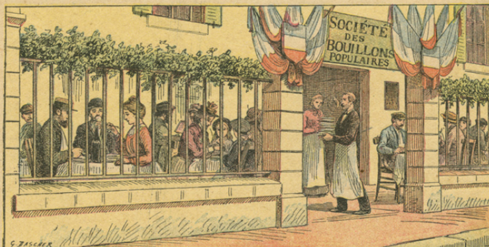
N° 12. — SOCIÉTÉS COOPÉRATIVES DE CONSOMMATION

Tout intermédiaire entre le producteur et le consommateur est un parasite qui, par son intervention, fait augmenter le prix des marchandises. Il est donc de l'intérêt du consommateur de se passer de son concours. C'est de cette préoccupation qu'est née l'idée de constituer des sociétés coopératives de consommation par lesquelles le bénéfice, qui autrement irait à l'intermédiaire, tombe dans la caisse des associés et diminue le prix de la marchandise à leur profit.