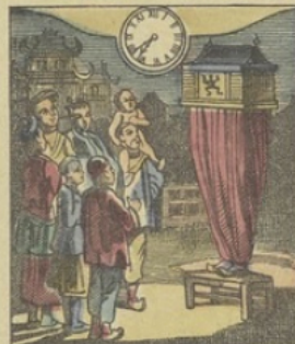
Il est Sept heures 37 m. du soir à PÉKIN (Chine) L'Homme Lanterne-Magique