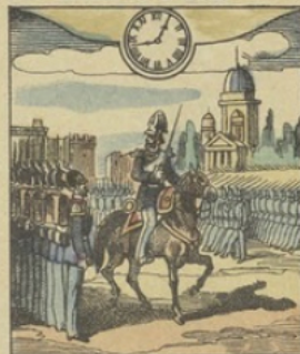
Il est Midi 44 minutes à BERLIN (Allemagne) Une Revue sur la Place Royale