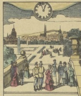
Il est Midi 56 minutes à VIENNE (Autriche) La célèbre promenade du Prater