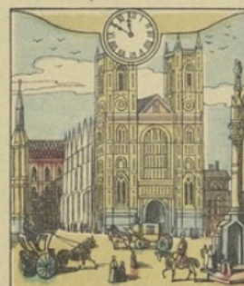
Il est Onze heures 50 m. du matin à LONDRES (Angleterre) Une rue de Londres près de Westminster