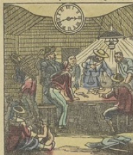
Il est Trois heures 41 m. du matin à SAN-FRANCISCO (Californie) Maison de jeu chez les chercheurs d'or