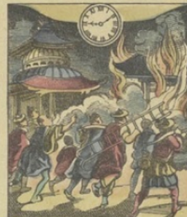
Il est Neuf heures 10 m. du soir à YOKOHAMA (Japon) Un incendie dans le quartier européen