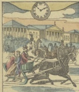
Il est Une heure 52 min. du soir à S-PÉTERSBOURG (Russie) La Perspective Neusky