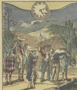
Il est Cinq heures 14 m. du matin à MEXICO (Mexique) Le départ des Muletiers