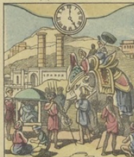
Il est Cinq heures du soir à DELHI (Indes Anglaises) Vue de Delhi, (ancienne capitale du Grand Mogol)