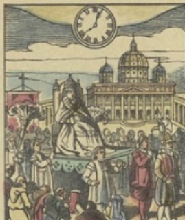
Il est Midi 40 minutes à ROME (Italie) Procession papale sur la Place St-Pierre