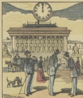
Quand il est MIDI à PARIS (France): Vue de la Place de la Bourse