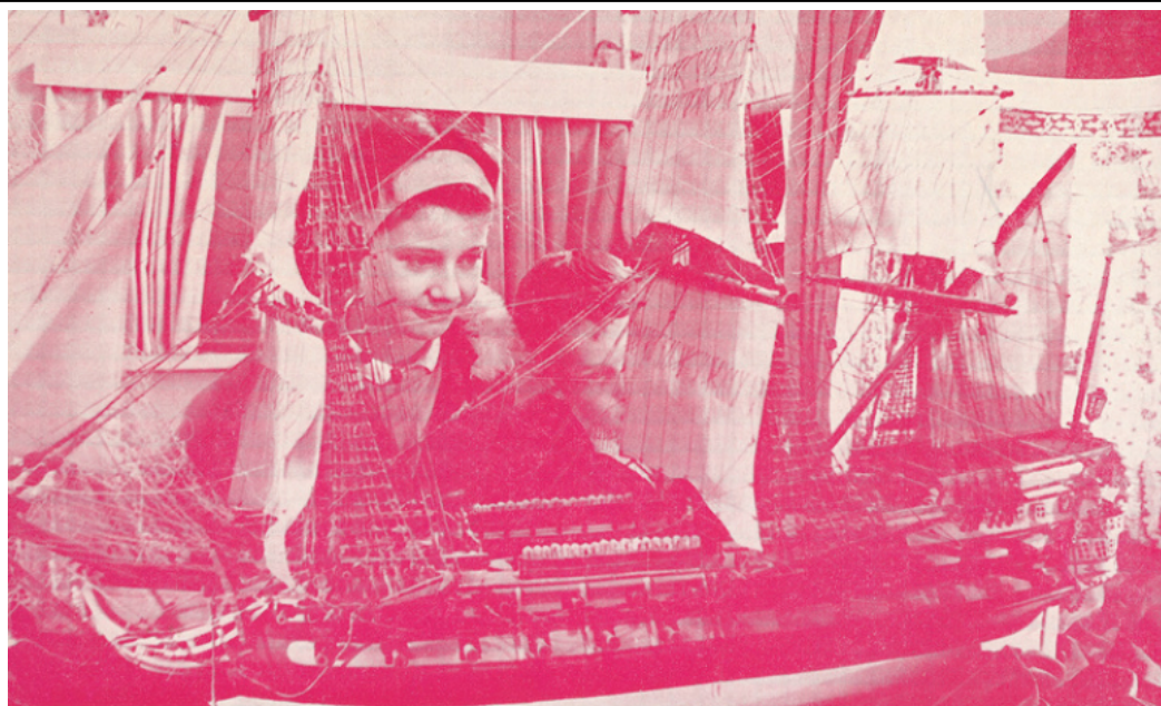
"LE PROTECTEUR" (1760)

reproduction exacte par Monsieur VINCHON de Guise 2.000 heures de travail