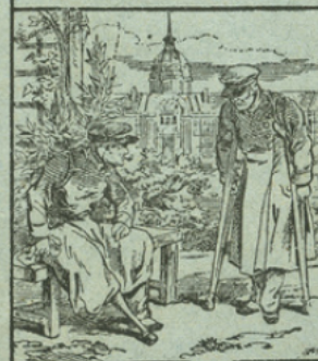
LA JAMBE DE BOIS