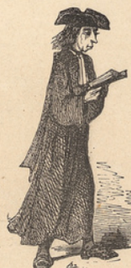
Professeur de l'école des Frères.