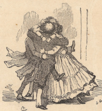
Et le tout finit comme un vaudeville.