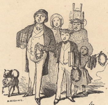
Cependant chacun revient heureux et satisfait.