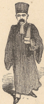
Professeur de l'Université.