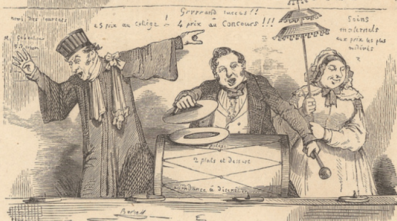
Comment M. Gribouillard se dispose à répandre les bienfaits de l'enseignement.