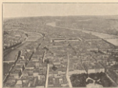
Les villes Lyon, quartier central.

Les gravures marquées A. G. et A. H., sont extraites des premières de l'Album géographique, de MM. Marcel Dubois et Camille Guy, et les secondes de l'Album historique de MM. Ernest Lavisse et André Fierroisier, ouvrages publiés par la Librairie Armand Colin.