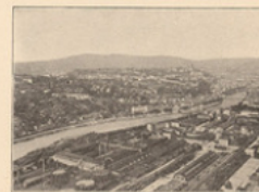
Les villes Lyon, la Saône et le coteau de Fourvières.