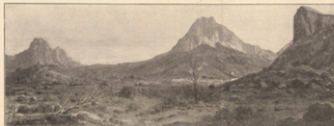
La Garrigue Partie inculte de la Garrigue, près Montpellier (Hérault.)