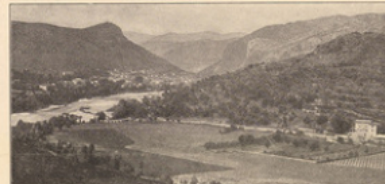
Les vallées La vallée du Gardon d'Anduze (Gard).