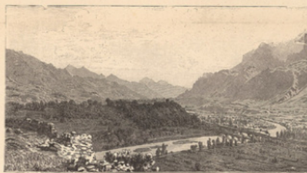
Les vallées La vallée du Grésivaudan en Isère.