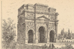
Orange : L'Arc de Triomphe.