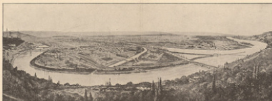
Les eaux Confluent de la Saône et du Rhône.