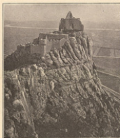
Le relief Château de Crosolès, près de Saint-Péry (Ardèche).