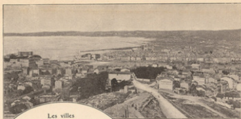
Les villes Vue générale de Marseille, prise de Notre-Dame de la Garde.