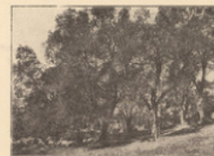
L'agriculture Oliviers aux environs de Nîmes.