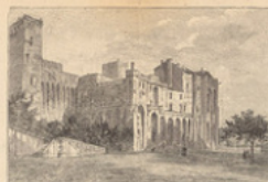
Avignon : Le château des Papes.