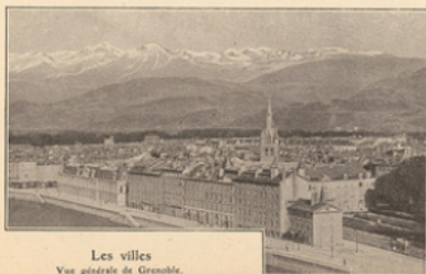
Les villes Vue générale de Grenoble.