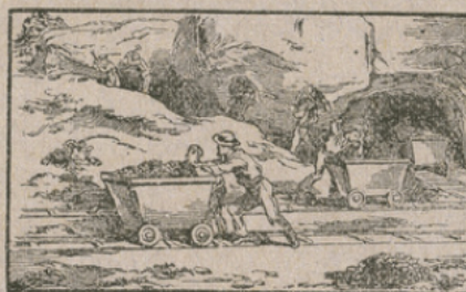
LA MINE DE FER