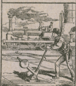
LES CHEMINS DE FER