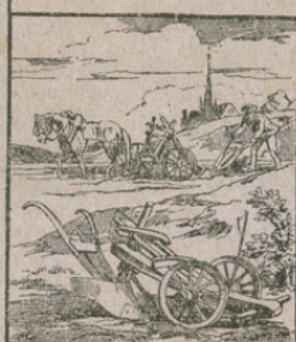
LE SOC DE CHARRUE