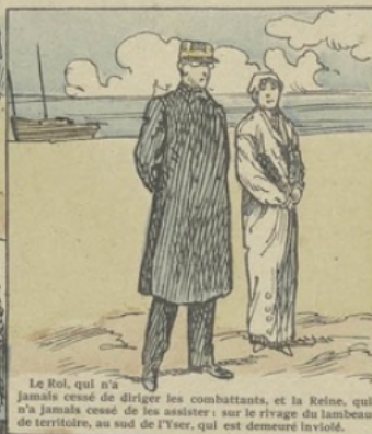
Le Roi, qui n'a jamais cessé de diriger les combattants, et la Reine, qui n'a jamais cessé de les assister: sur le rivage du lambeau de territoire, au sud de l'Yser, qui est demeuré inviolé.