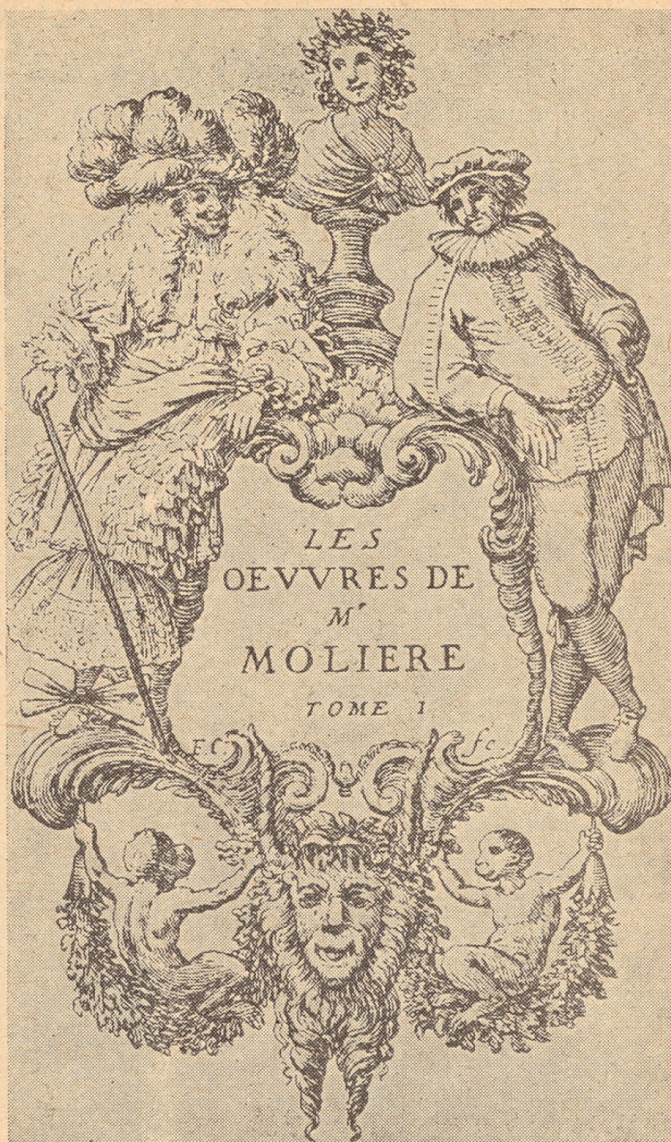
Frontispice de l'édition des œuvres de Molière publiée en 1666.