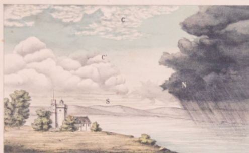
S Stratus. N Nimbus. C Cirrus. C' Cumulus.