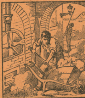
USINE A GAZ

Extrait de l'Imagerie des connaissances utiles par Ad. LINDEN