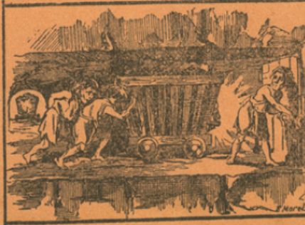
LES GALERIES DE MINE