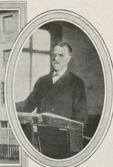
M. Vincent d'Indy, un des fondateurs et directeur actuel de la "Schola".

Il convient de faire l'éloge de l'émulation. C'est grâce à elle que les jeunes hommes, aux heures où le travail pèse sur leurs épaules comme le plus lourd des fardeaux, reprennent courage et luttent avec une nouvelle vaillance; c'est aussi à son pouvoir occulte, ainsi qu'à celui de la concurrence, que nous devons les progrès les moins contestables de la civilisation moderne.