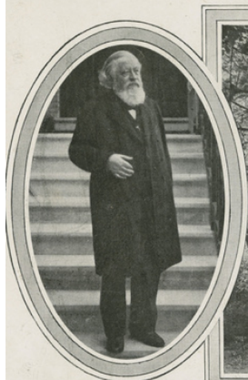
M. A. Guilmant, l'un des fondateurs de la "Schola Cantorum".