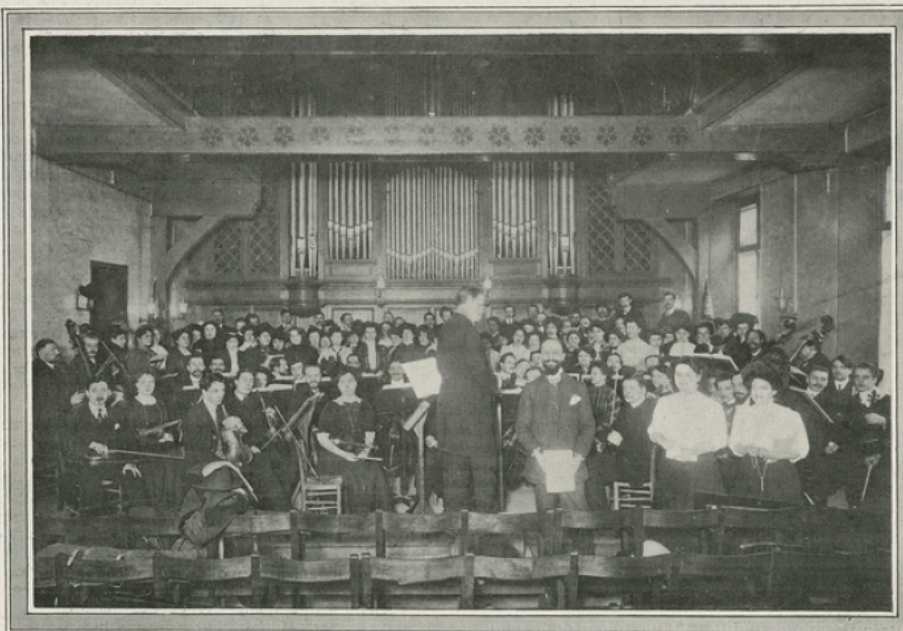
Une répétition à la "Schola Cantorum", dirigée par M. Vincent d'Indy.