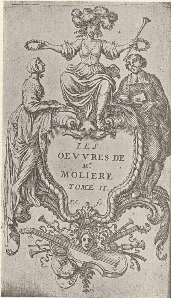
1. Molière dans un rôle de bourgeois (d'après F. Chauveau).

On n'a pas de document contemporain représentant Molière dans Chrysale; mais le costume de Molière dans le rôle d'Arnolphe peut sans doute donner quelque idée de son costume dans les rôles bourgeois. D'ailleurs le costume de Chrysale était ainsi composé : « justaucorps et haut-de-chausses de velours noir, veste de gaze violette et or garnie de boutons, un cordon d'or, jarretières, aiguillettes et gants ».