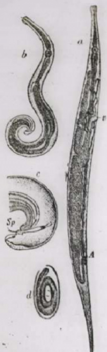
— Oxyurus vermicularis . a, femelle; v, vulve; A, anus; b, mâle; c, extrémité postérieure enroulée montrant le spicule (Sp); d, œuf. D'après Leuckart.