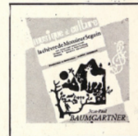
La Chèvre de M. Seguin (Baumgartner) MC - 2505