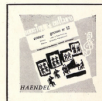
Concerto Grosso (Haendel) MC - 2504