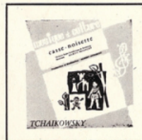
Casse-Noisette (Tchaikovsky) MC - 2501