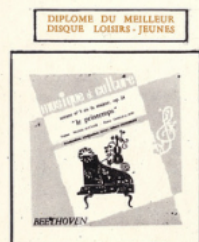
Sonate du Printemps (Beethoven) MC - 3003