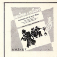
Concerto pour flûte (Mozart) MC - 3002