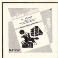
La Chasse (Haydn) MC - 3001