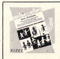
Jeux d'enfants (Bizet) MC - 2503