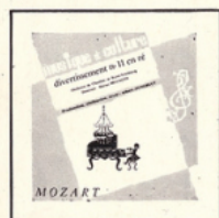
Divertissement en ré (Mozart) MC - 2502