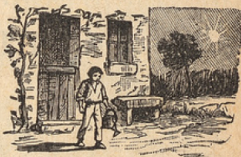
FIGURE 1. — Le soleil se lève et Paul est déjà debout.

Le petit Paul est déjà debout, 3 un arrosoir à la main.