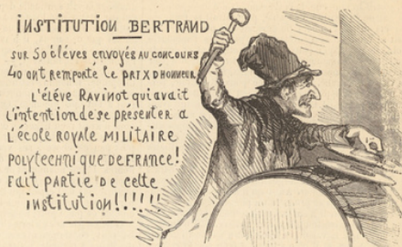
Le Puff et la Réclame.