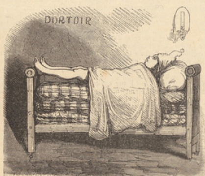
Les élèves sont bien ecuchés. — Extrait du prospectus.