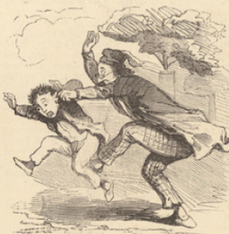
EN L'ABSENCE DES PARENTS. Vilain polisson, voilà ce que tu mérites.