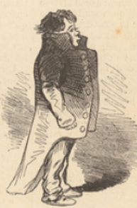
Les habits du nouveau.