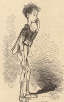
Les habits de l'ancien.