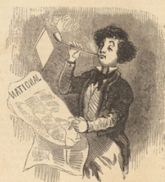
Très avancé pour son âge.