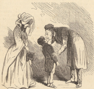
EN PRÉSENCE DES PARENTS. Ce cher enfant, certainement nous en sommes très-content.