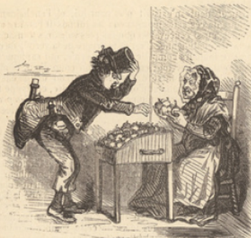
Un élève prévoyant.