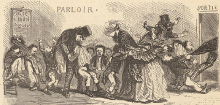
Aspect du parloir le jour de la rentrée.