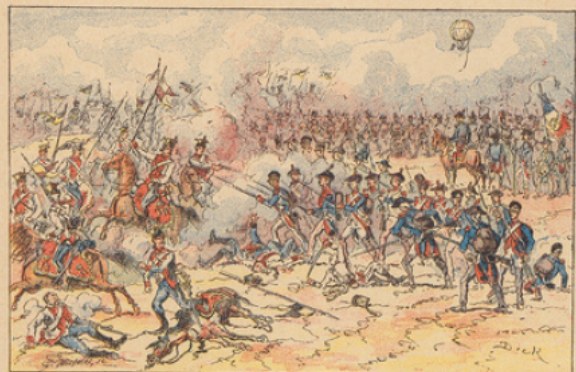
Bataille de Fleurus (26 juin 1794). — L'armée de Sambre-et-Meuse, commandée par Jourdan, repousse les charges de la cavalerie autrichienne.