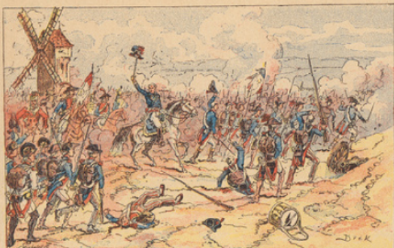
Bataille de Valmy (20 septembre 1792). — Les jeunes soldats de Kellermann et de Dumouriez repoussent les Prussiens commandés par Brunswick.

A. QUANTIN, IMPRIMEUR-EDITEUR. 7, rue Saint-Benoit, Paris.