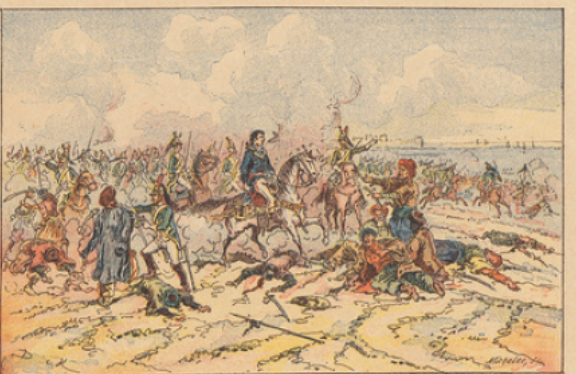
Bataille d'Aboukir (25 juillet 1799). — Les dragons de Murat jettent les Turcs à la mer ; Mustapha pacha se rend.