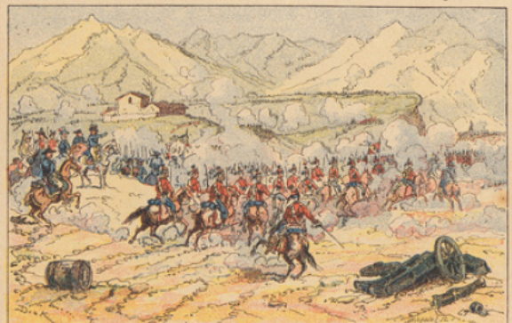
Bataille de Rivoli (14 janvier 1797). — Bonaparte fait charger les hussards qui culbutent les Autrichiens commandés par Alvinzi.