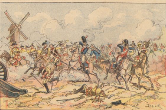
Bataille de Marengo (14 juin 1800). — Charge des grenadiers à cheval de la garde consulaire.