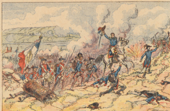
Bataille de Jemmapes (6 novembre 1792). — Les batteries autrichiennes sont enlevées à la balonnette par les troupes de Dumouriez.