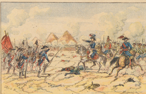
Bataille des Pyramides (21 juillet 1798). — « Soldats, souvenez-vous que du haut de ces Pyramides quarante siècles vous contemplent ! »