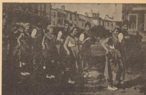
Danseurs du groupe folklorique du Bouleou (P.-O.)