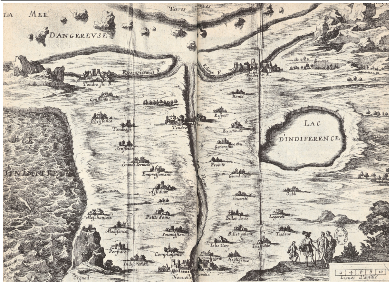
Carte de Tendre ou comment aller « de Nouvelle-Amitié à Tendre »,

extraite du t. I de Clélie de Mlle de Scudéry, 1654.