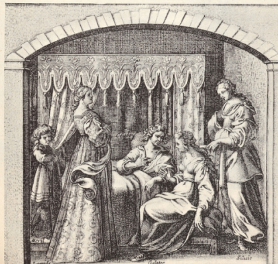
La précieuse reçoit habituellement dans sa chambre, au premier étage, étendue sur son lit, tandis que ses visiteurs se tiennent dans la ruelle, entre le lit et le mur; on remarquera dans cette gravure de Rabel la jeunesse du laquais qui écarte le rideau de l'alcôve : Almanzor, dans Les Précieuses ridicules , est aussi un « petit garçon » (sc. 11, l. 19).