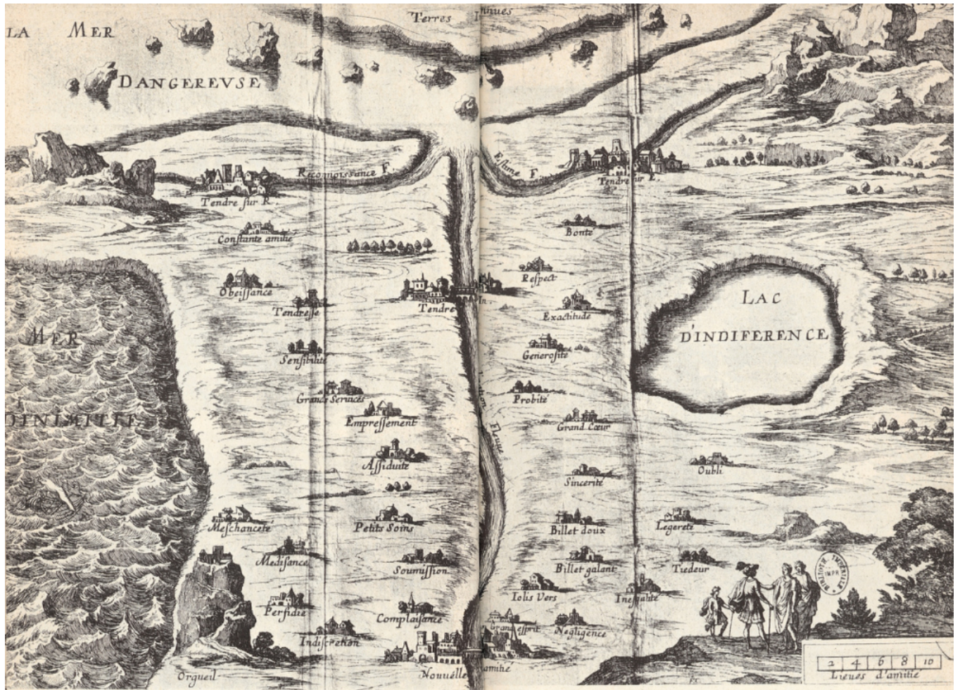
Carte de Tendre ou comment aller « de Nouvelle-Amitié à Tendre »,