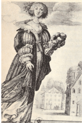
Précieuses et précieux (gravures d'Abraham Bosse).