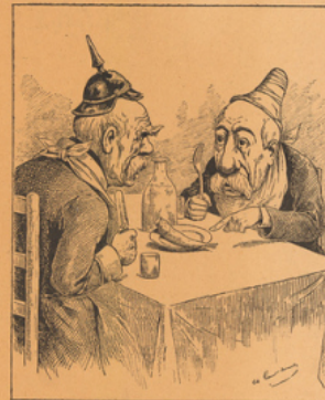
APRÈS LES JOURS GRAS Reproduction d'une caricature de Gilbert-Martin, dans le Don Quichotte .

Ce nouveau volume, de l'auteur des grands ouvrages sur les Mœurs et la Caricature, est, en quelque sorte, une suite au Bismarck raconté par l'image qui obtint l'année dernière, un succès si considérable. C'est le second volume d'une grande collection qui doit faire défiler sous les yeux du public toutes les figures historiques du passé et du présent.