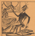
Crispi mord des traits cheux de Bismarck Vignette de Flackelstein .

I. Particularités des caricatures italiennes. — II. La France et l'Italie vus par le crayon des dessinateurs. — III. Bismarck et Crispi. — IV. Les portraits de Crispi. — V. L'image et Crispi avant 1887. — VI. Les caricatures personnelles sur Crispi. — VII. Les caricatures sur Crispi « Italien ». — VIII. Les caricatures sur Crispi « Allemand ». — IX. Les caricatures sur Crispi « Africain ». — X. Les caricatures françaises sur Crispi. — XI. Caricatures étrangères.