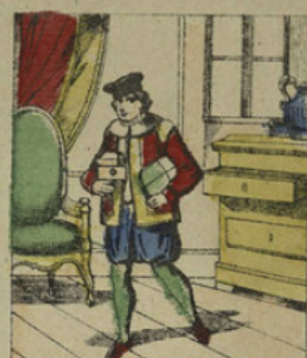
Le lendemain, il délogait de chez cette dame en faisant main basse sur tout ce qu'il trouva; il s'éloigna sans but jusqu'à Reine-Moulin.