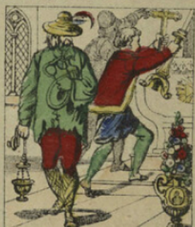
Par malheur, il rencontra quelque temps après, un de ses anciens amis saltimbanque qui l'entraîna dans la voie du crime et avec lequel il pillait les églises.