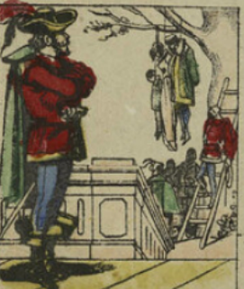
Cartouche se rendit en Angleterre où il organisa une nouvelle bande; il pillait les palais et fit pendre un lord sa femme et son enfant.