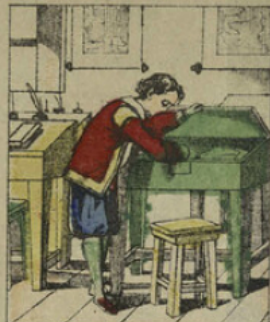
Placé dans un lycée, Cartouche fit de brillantes études, et déjà manifesta ses vicieux penchants en dérobant tous les jouets de ses camarades.