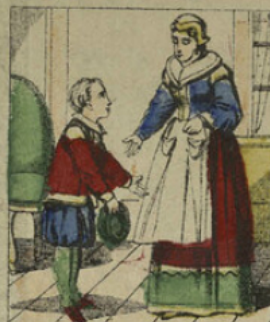
Chassé du collège pour ses larcins, Cartouche, n'osant pas retourner chez son père, se rendit chez la mère d'un de ses condisciples et s'en fit accueillir.