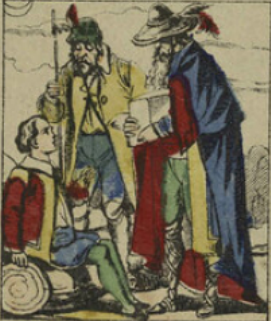
La fatigue l'arrêta sur la route et il s'endormit dans un buisson. A son réveil, il se vit entouré de plusieurs hommes à figures sinistres qui le dépouillèrent.