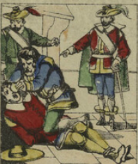
Pour contraindre les gens à se dépouiller, Cartouche leur faisait ouvrir le visage avec un masque de poix ou les brûlait avec des acides corrosifs.