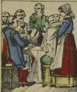
Dominique Cartouche naquit à Paris d'honnêtes marchands; sa naissance fut une fête pour sa famille qui n'avait que lui de garçon.