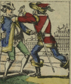
Cartouche avec sa bande se rendit à Paris et dévalisa les faubourgs à main armée. Cette attaque audacieuse jeta la consternation dans la capitale.