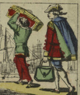
De retour en France, Cartouche continua ses brigandages. Devenu très-riche et voulant jouir du fruit de ses crimes, il se décida à passer à l'étranger.