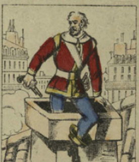
Traqué par la police, Cartouche se réfugia dans une maison de la rue de Cléry, y soutint un véritable siège et finit par s'échapper par la cheminée.