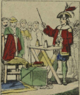
Ces hommes étaient des saltimbanques de profession. Cartouche s'engagea dans leur troupe et devint bientôt le plus habile escamoteur de la compagnie.