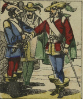
Dès lors il marcha sans-retour vers l'abîme et se fit remarquer par son énergie. Il organisa une troupe de malfaiteurs de son espèce et devint leur chef.