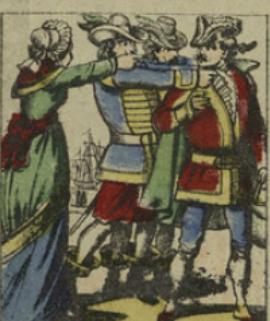
Au moment de s'embarquer, Cartouche, reconnu par une femme qu'il avait maltraitée, fut arrêté par des soldats et livré à la justice.