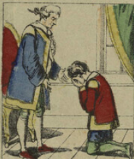
Sans cesse maltraité par ces gens et n'ayant que du pain noir pour toute nourriture, Cartouche s'échappa, retourna chez son père et obtint son pardon.